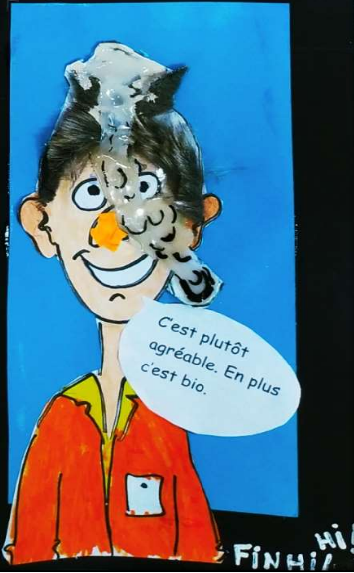
En cet homme il y'a peut-être un pollueur. Mais aussi un soigneur.